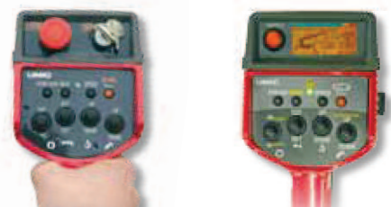
Radio control de serie